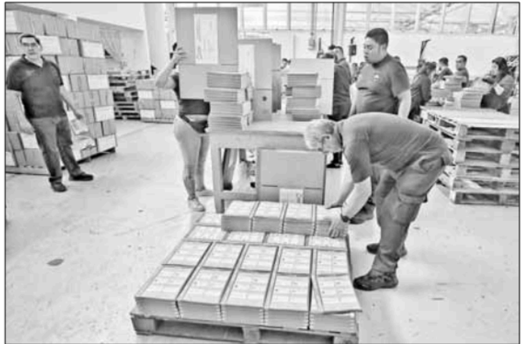
▲ Trabajadores de los Talleres Gráficos de México comenzaron con el embalaje y distribución de los paquetes electorales que se utilizarán en las votaciones del 2 de junio en la Ciudad de México.

Adicionalmente, detalló, también se distribuyen 185 mil 310 actas electorales y 213 mil 444 documentos auxiliares, entre los que destacan el acta de la jornada electoral,