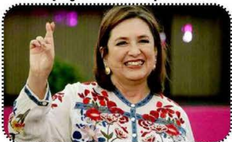
Xóchitl Gálvez Ruiz