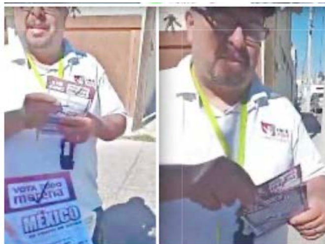
■ En redes sociales causó inconformidad que carteros entreguen propaganda de Morena.

Sepomex aceptó la entrega y demandó no atentar contra sus mensajeros.