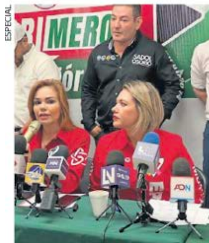
El PRI de Sinaloa exigió el esclarecimiento del crimen.

Medios locales indicaron que en el pasado él y su familia había sido objeto de ataques por parte de grupos armados y que su territorio fue invadido por la organización criminal conocida como La Línea . ●