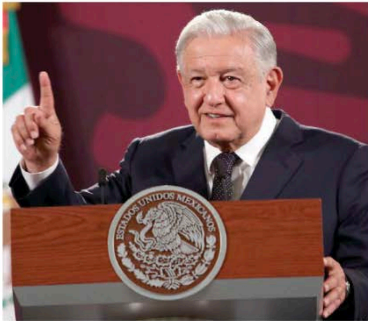
EL PRESIDENTE López Obrador, ayer, en conferencia de prensa.