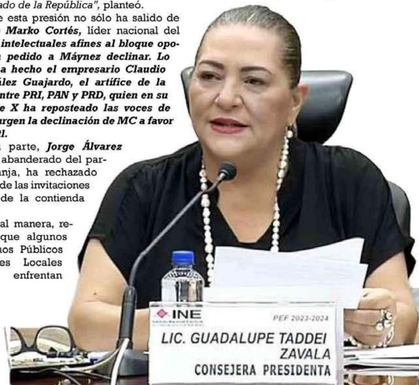
LIC. GUADALUPE TADDEI ZAVALA CONSEJERA PRESIDENTA

problemas en sus presupuestos, pero aclaró que ello no tiene nada que ver con la papejería electoral. Lo anterior, luego de que la Comisión de Vinculación del INE informó que los organismos electorales locales de San Luis Potosí, Morelos, Zacatecas y Yucatán se encuentran en riesgo presupuestal alto rumbo a la elección del 2 de junio, en tanto que otras más se ubican en riesgo medio.