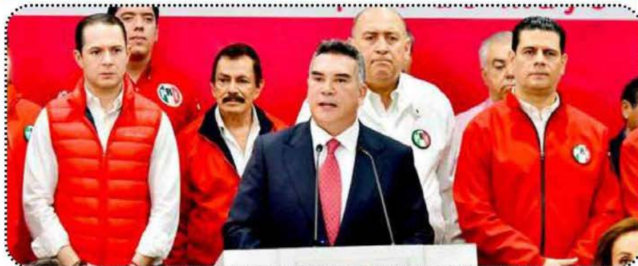
Alejandro "Alito" Moreno Cárdenas, dirigente del PRI

"Eso no existe en nuestro sistema electoral"