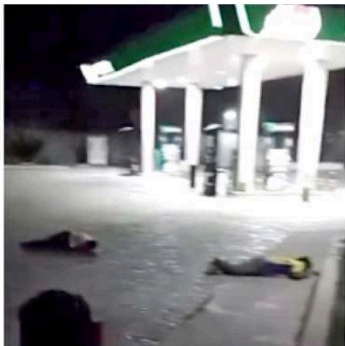
■ Tras el ataque armado, los cuerpos de las víctimas quedaron cerca de una gasolinera.