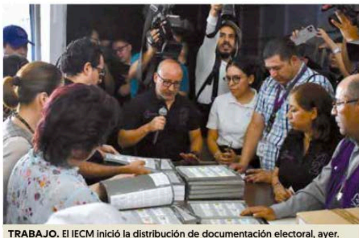
TRABAJO. El IECM inició la distribución de documentación electoral, ayer.

Como parte de las acciones de esta última etapa destacó la preparación de los sistemas de conteo